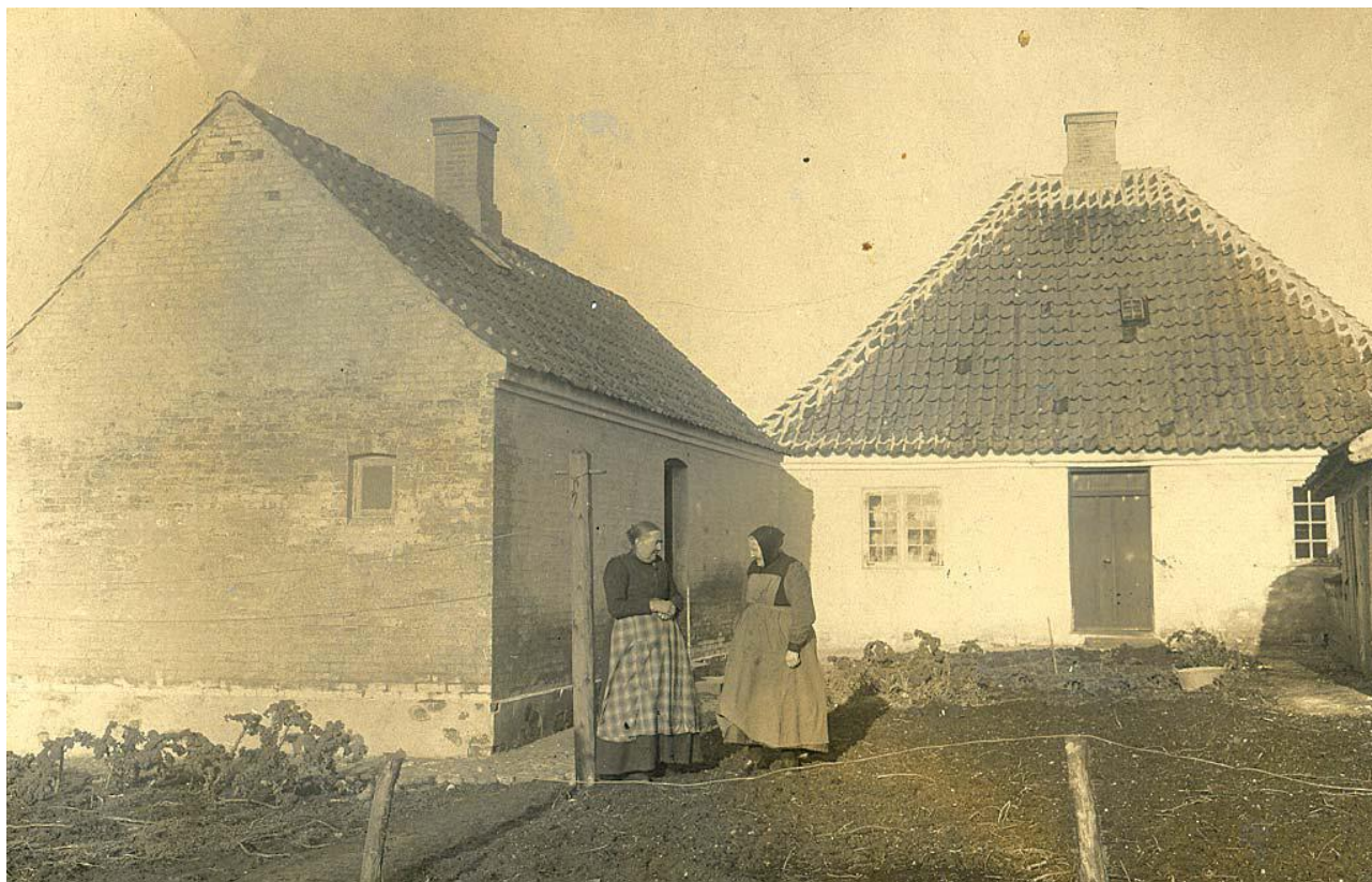
Hospitalets baggård med to beboere, Lise og Sørine, ca. 1940.