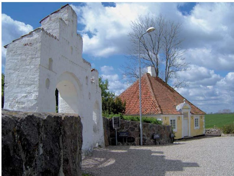
Hospitalet anno 2007